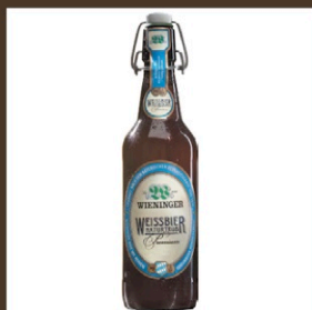
Nr. 4 Wiener Weissbier cl 50 € 5.50