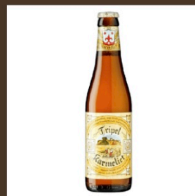
Nr. 6 Tripel Karmeliet cl 33 € 4.50