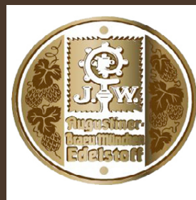
Nr. 14 Augustiner B. München cl 50 € 5.20