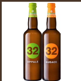
32 Oppale - Audace cl 75 € 13.00