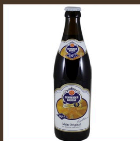
Nr. 8 Schneider Weisse cl 50 € 6.60