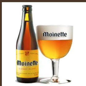
Nr. 12 Moinette cl 33 € 4.50