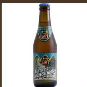
Nr. 2 Blanche des honnelles cl 75 € 9.50