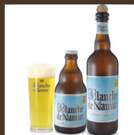
Nr. 3 Blanche de Namur cl 33 € 4.50 cl 75 € 9.50