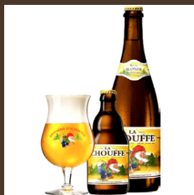
Nr. 16 La Chouffe cl 33 € 4.80