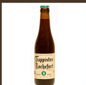
Nr. 19 Trappistes Rochefort cl 33 € 4.70