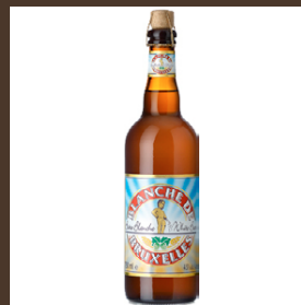
Blanche de Bruxelles cl 75 € 9.50