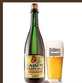
Nr. 9 Saison Dupont cl 75 € 11.00