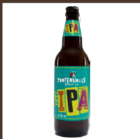
Nr. 18 Porterhouse cl 33 € 4.70