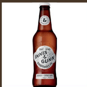
Nr. 7 Innis & Gunn cl 33 € 5.20