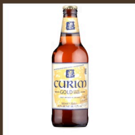
Nr. 5 Curim Gold cl 50 € 5.50