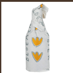
Nr. 15 Bloemenbier cl 33 € 4.50