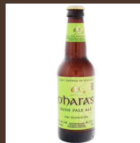
Nr. 17 O.Hara.s cl 50 € 6.00